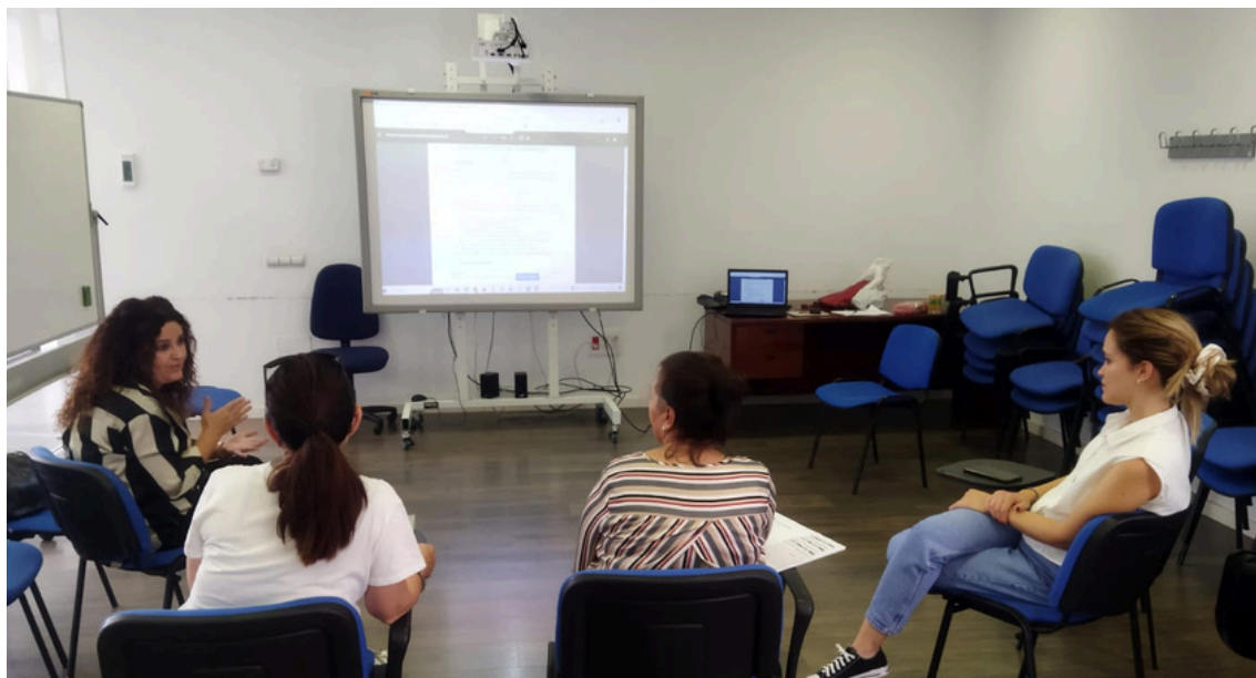
Un momento de la Asamblea General celebrada en 2023.

La reunión permitió dar a conocer la situación de la asociación y analizar el DAFO de la institución.