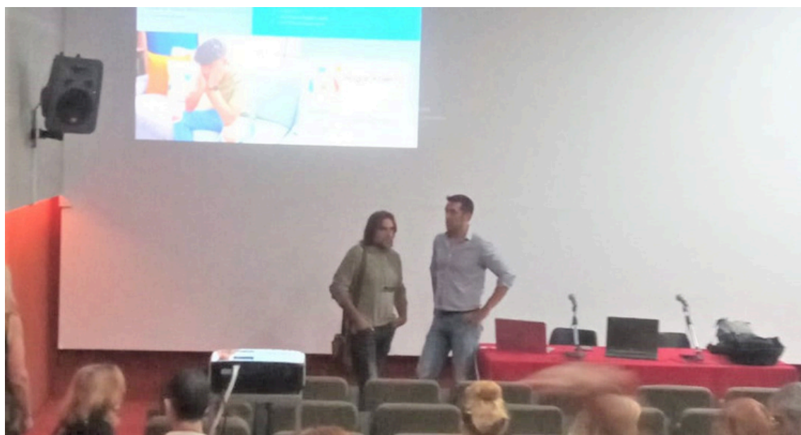
Un momento del taller sobre conductos autolesivas en adolescentes.